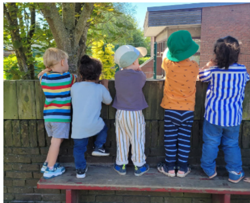
Das Sommerfest und die Ferien sind in Sichtweite.

Am 03.07.26 verabschieden wir uns von unseren zukünftigen Schulanfängern, wir wünschen den Kindern und ihren Familien eine schöne Einschulungsfeier, eine gute Schulzeit und lieben Dank, dass ihr uns eine so schöne Zeit geschenkt habt.